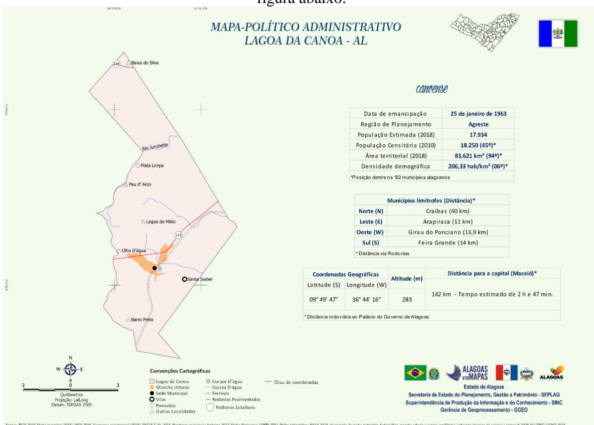
Figura 1: Mapa de Lagoa da Canoa.

3.1. Os serviços serão executados no município de Lagoa da Canoa, no Estado de Alagoas conforme figura abaixo: