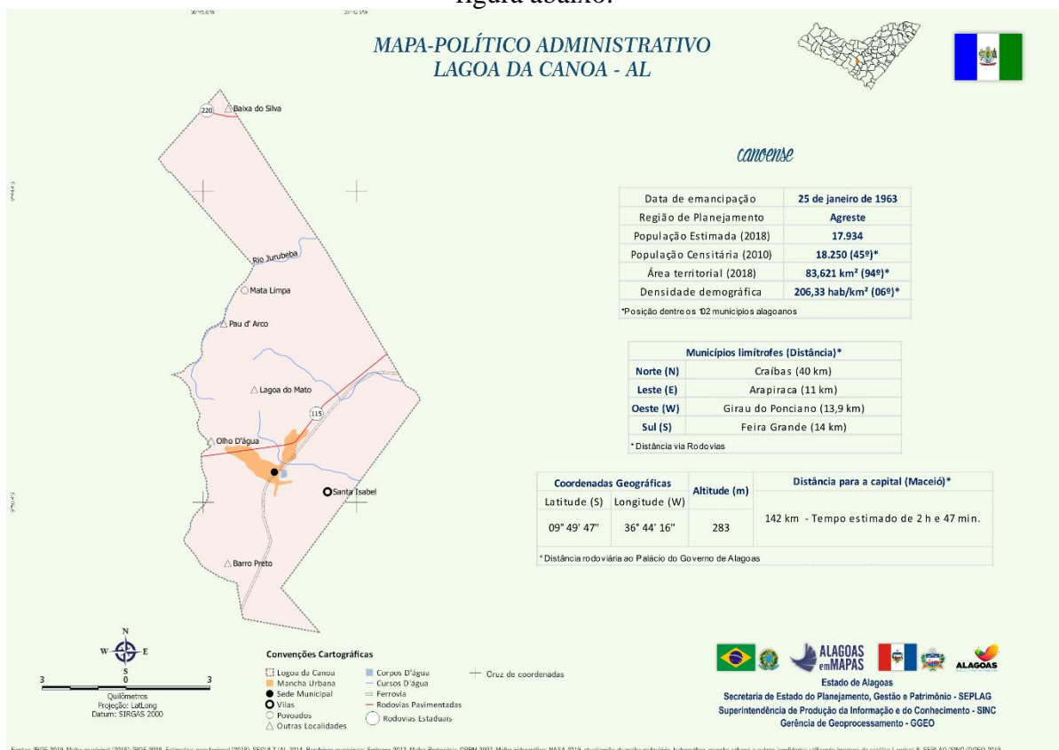
Figura 1: Mapa de Lagoa da Canoa.

3.1. Os serviços serão executados no município de Lagoa da Canoa, no Estado de Alagoas conforme figura abaixo: